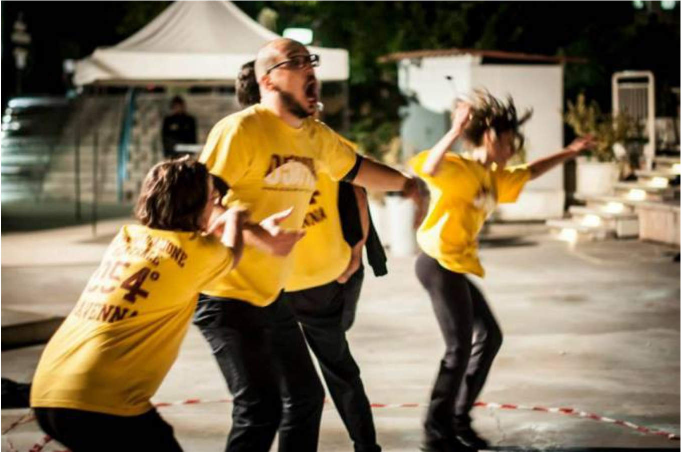
AREA SPETTACOLI E CONFERENZE a cura di Mirella Santamato